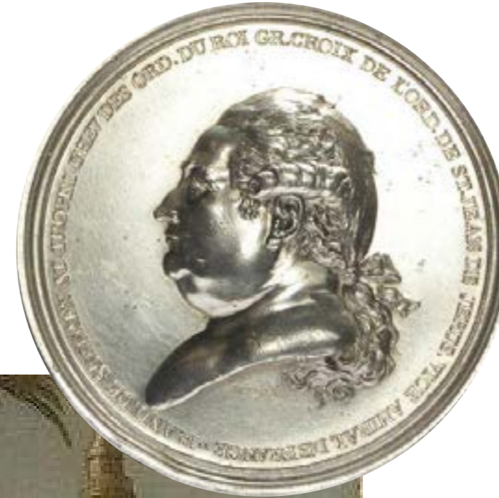
Source : Pompeo Batoni, Portrait de Pierre André de Suffren de Saint Tropez (vers 1785), château de Versailles. Wikipedia

Source : Médaille en argent émise en 1784 par les États de Provence en l'honneur de Suffren et portant au revers un résumé de sa campagne aux Indes. (Musée de Londres)-Wikipedia