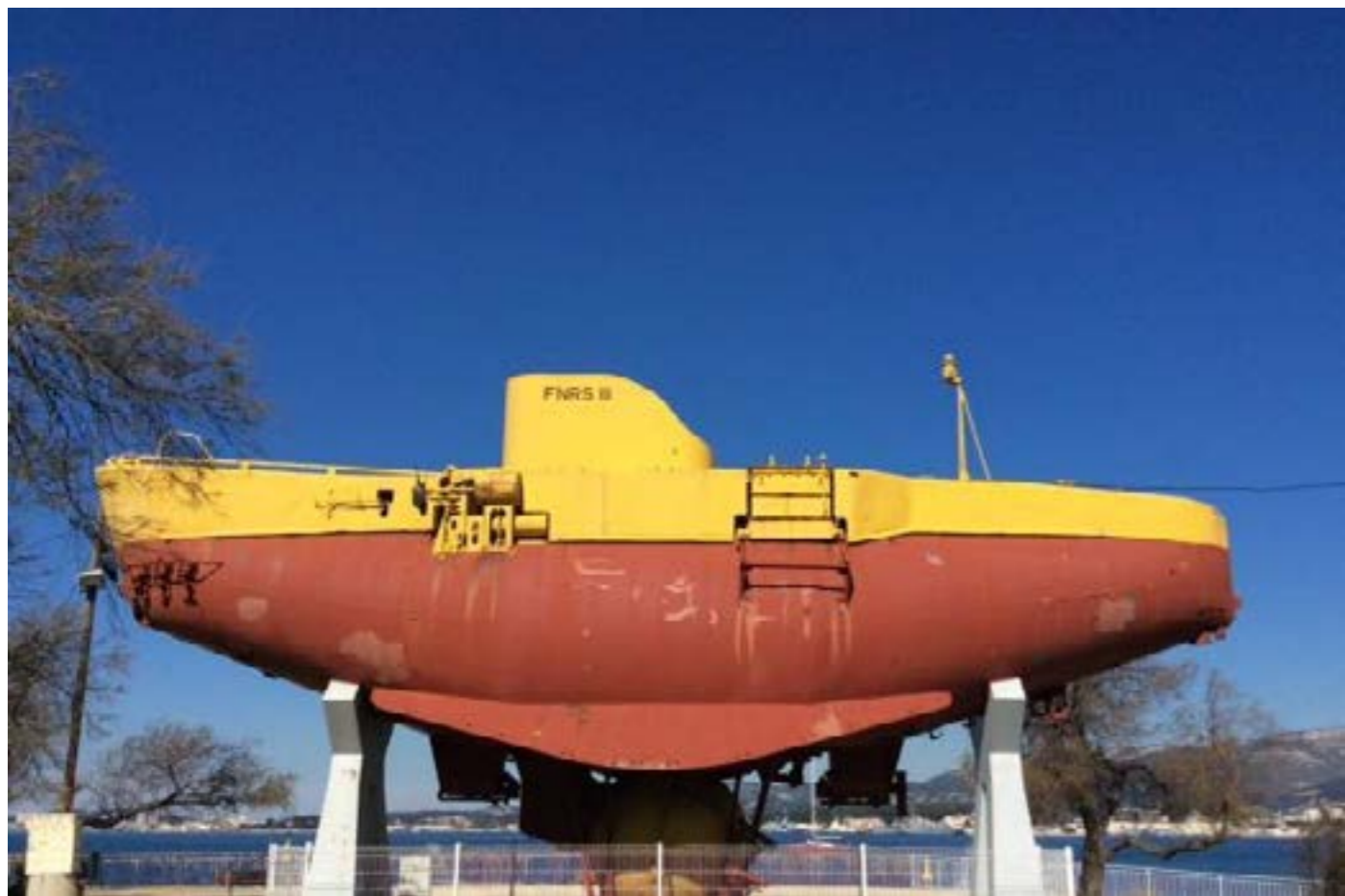
Le FNRS 3