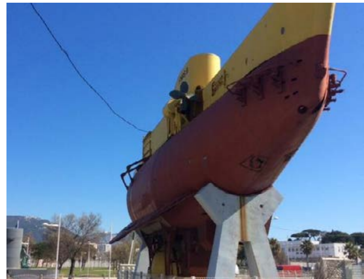
Le FNRS 3

Bien entendu, le FNRS 3 n'est pas oublié de ceux qui en ont la garde. Mais, mieux que quiconque, ils savent que sa maintenance ne peut seulement consister à gratter, piquer et repeindre sa coque et que la conservation d'un tel objet de notre patrimoine marin ne peut se concevoir qu'accompagnée d'un projet destiné à le mettre en valeur.