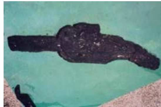
Fragment du gouvernail

A ces découvertes archéologiques remarquables, s'est ajouté un corpus d'études scientifiques qui a fait l'objet de publications complètes et qui a apporté un éclairage nouveau relatif à l'architecture navale antique.