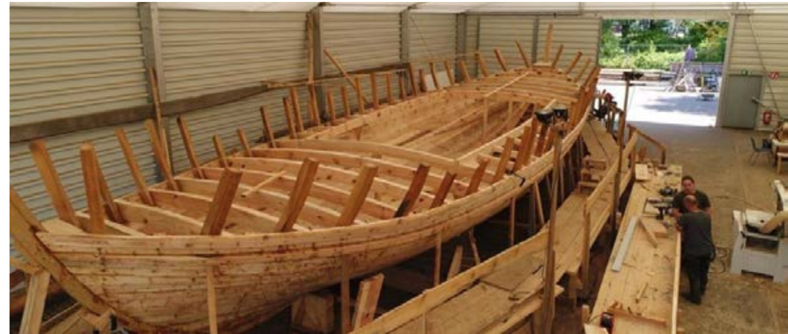
Le chantier de construction