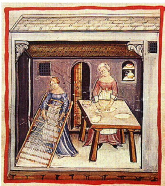
Fabrication des pâtes, Tacuinum Sanitatis de Vienne, 14e siècle

Nous avons pu suivre, dans le chapitre sur les pâtes fraîches, les pâtes mésopotamiennes appelées risnatu , devenir rishta dans la cuisine arabo-persane, puis reshteh en Iran et rechta au Liban, en Tunisie et en Algérie.