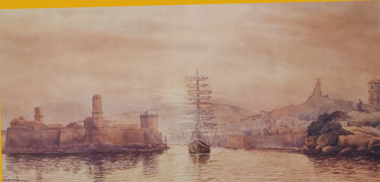
Aquarelle de Jean Brun, représentant le Belem à la sortie du Vieux-Port , le 8 mai 2024, lors de la parade maritime en l'honneur de la flamme olympique.