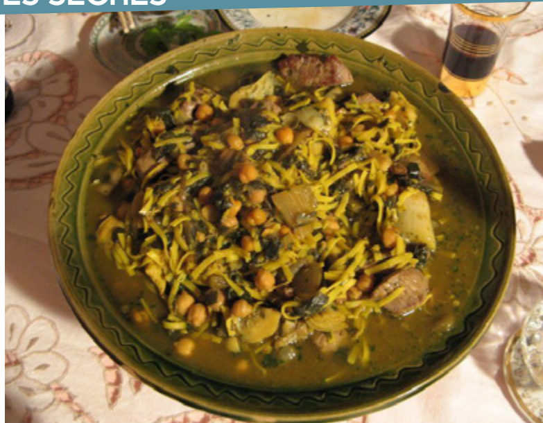
Recette d'itriyya

Certaines de ces pâtes sont préparées à base de semoule et non de farine de blé. Comme dans la cuisine de Bagdad, ces pâtes épaississent les bouillons ou les ragoûts, elles sont aussi présentes dans des potages. Le mot fidaws est traduit en espagnol par fideos, fideus en catalan, qui se transforme en fidei et fidaux en provençal, au 14e siècle. On retrouve ensuite des gros vermicelles savoyards appelées fidès. La cuisson des pâtes "à la fidé", les pâtes étant revenues dans du beurre avec ail et oignon avant qu'on y ajoute eau ou bouillon, ne semble pas être un héritage arabe.