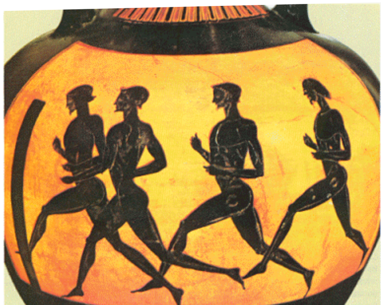
Course à pied représentée sur un vase antique.

L'homme, à l'image des dieux, est un être debout. Là est sa grandeur que l'Art grec, dans sa sculpture, ne cesse d'honorer. Les kouroï sont tous des jeunes gens debout. Toutes les statues depuis l'époque archaïque jusqu'au grand classicisme sont, en général, dressées droites. L'artiste n'imagine pas un homme allongé dans les flots de la mer ou d'un fleuve. Sur terre et debout, l'homme est là où les dieux l'ont placé. Quand il essaie de s'en extraire comme Icare, il chute ! On ne transgresse pas les limites, ni des cieux, ni des eaux.