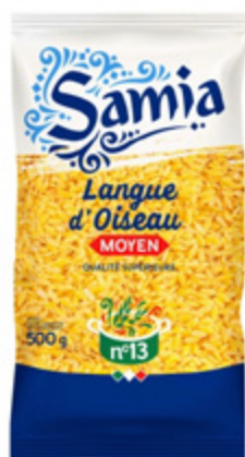
Pâtes algériennes actuelles, langue d'oiseau ou grain de riz.

Dans l'Espagne arabe, les livres de recettes décrivent non seulement des pâtes de type vermicelles appelées itriyya, mais aussi des fidaws, qui correspondent aux pâtes en forme de grain de céréales ou de petits carrés de pâte. Le mot de fidaws ou fidawsh est inconnu au Proche Orient et semble d'origine mozarabe ou berbère.